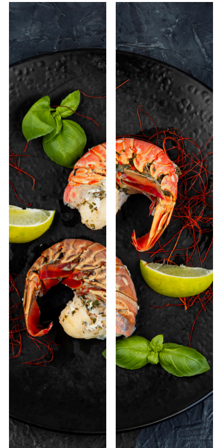
Table en 1ère Ligne

Finger sacher aux framboises Confites, fraîches et glacées au yuzu